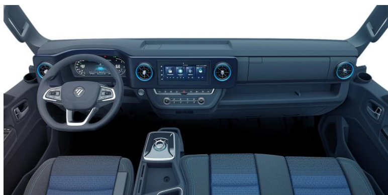
Tecnologia que simplifica, conforto que surpreende.

Silêncio, eficiência e potência em movimento. A força do trabalho, agora elétrica.