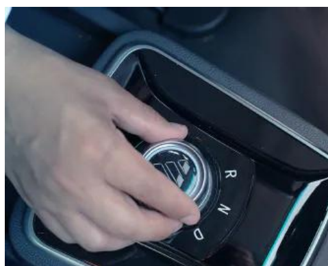
Tecnologia em cada detalhe.