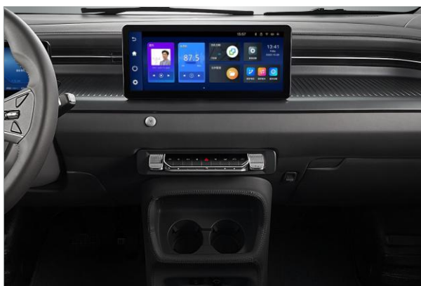
Central multimídia com tela HD e câmera de ré